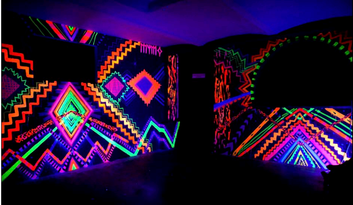
Mimo Mali, Light in the Darkness, 2013, Ultraviolet Sun portal Installation

Ausstellung: LIGHT IN THE DARKNESS von MIMO MALI